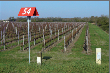
Différents types de bornes repérant les canalisations de transport