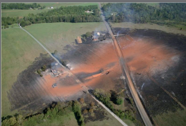
Conséquences d'une fuite sur une canalisation de transport, Appomatox (USA), 14 septembre 2008.

C'est le propriétaire et/ou l'exploitant de la canalisation.